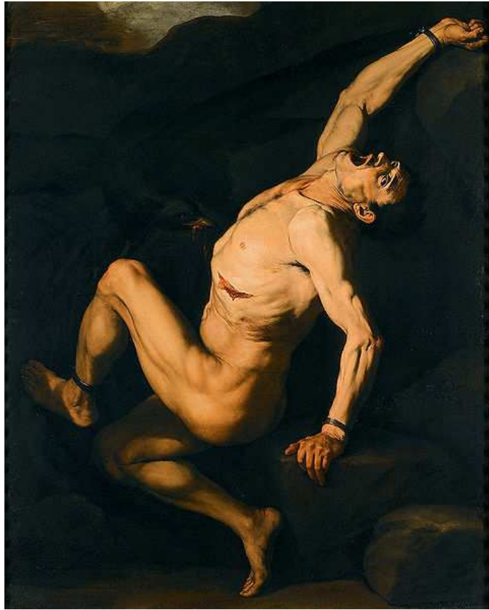
Prometheus by José de Ribera. Oil on canvas (c1630).